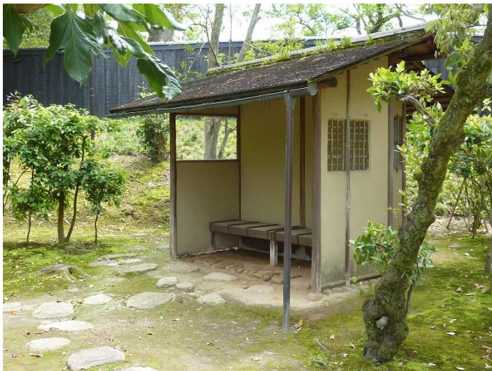
Banc de méditation du jardin du Taizō-in - Myōshin-Ji - Kyōto