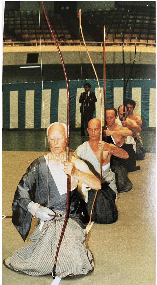
40 ans de la création de la Fédération Japonaise de Kyûdô au Budôkan de Tôkyô en 1989

Au cours d'une interview, il était demandé à une championne de tir occidentale quel était son entraînement quotidien. Réponse : 10 heures et 500 flèches... D'accord, il y a poulies, viseur, décocheur. Mais quand même ! Et 10 heures par jour ! Lorsqu'on voit un reportage montrant des maîtres de Kyûdô formant un « shareï », c'est l'aboutissement d'heures de répétition de la gestuelle. Les ar-