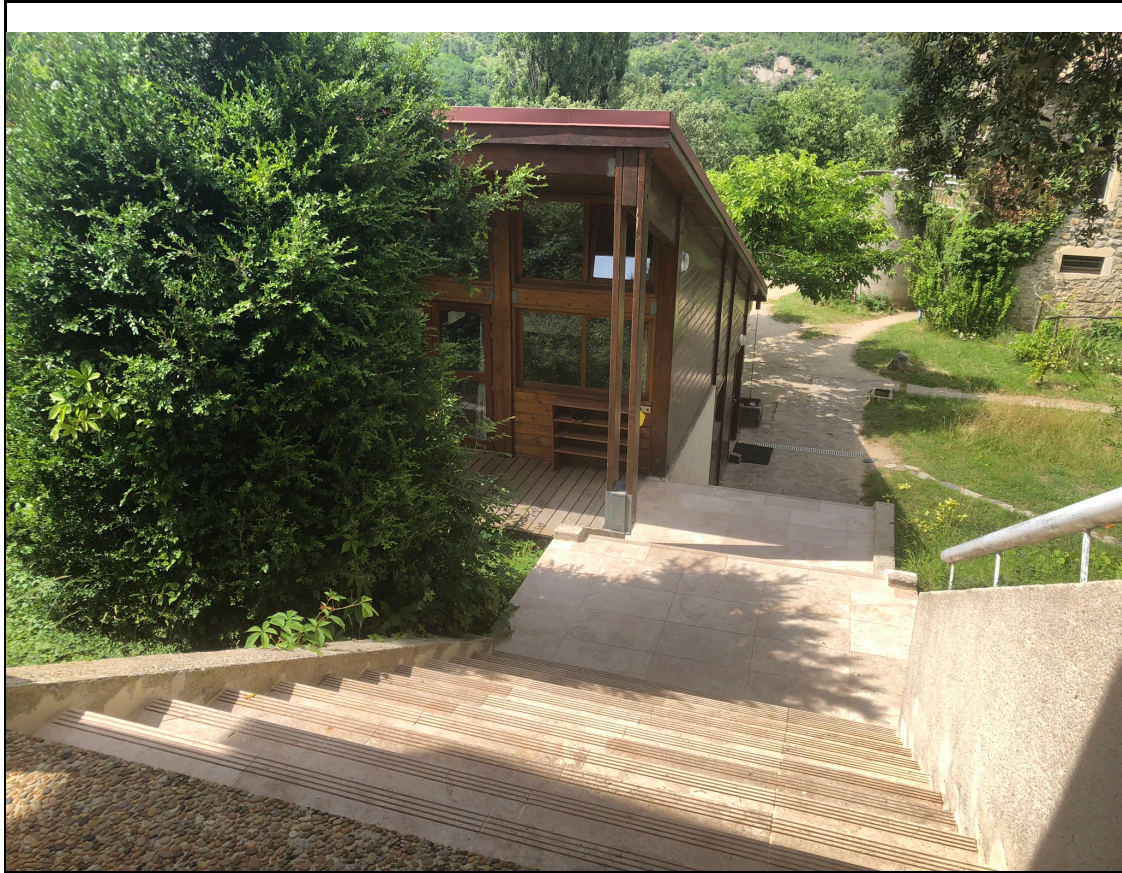
Le (nouvel) escalier du Dôjô de l'Esprit Direct

Une année riche pour le Centre s'achève, avec la réfection (réussie) de l'escalier du Dôjô rendue possible grâce à votre soutien, ainsi que le remplacement de la vieille chaudière de la magnanerie par une pompe à chaleur.